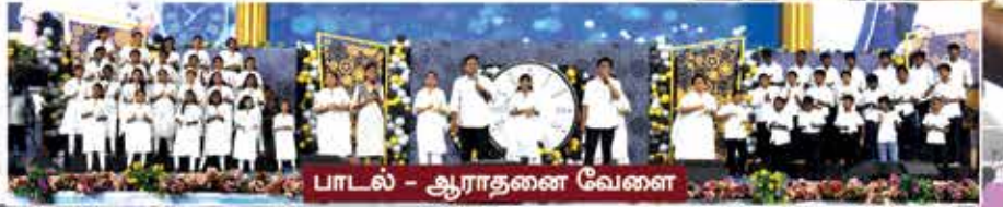
பாடல் - ஆராதனை வேளை