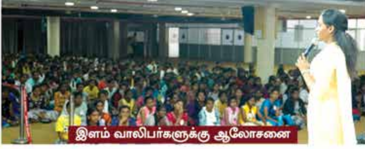
இளம் வாலிபர்களுக்கு ஆலோசனை

முக்கியத்துவத்தை பற்றியும், அபிஷேகத்தின் அவசியத்தை பற்றியும் கற்றுக் கொடுக்கப்பட்டது.