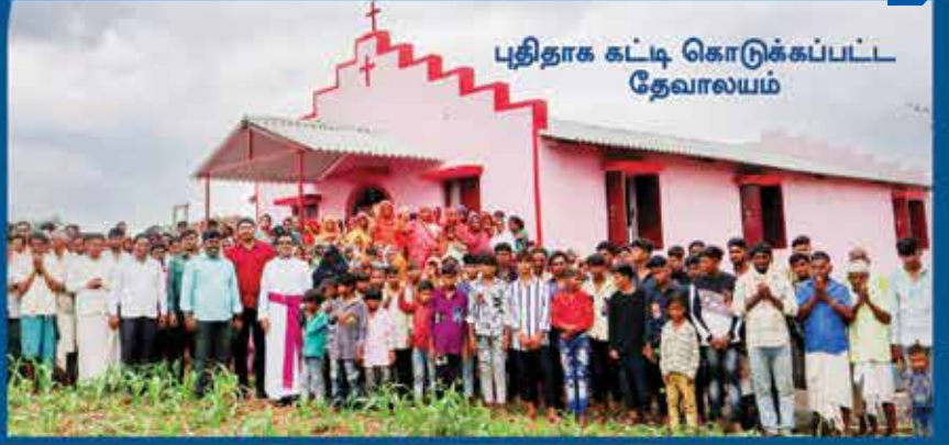
புதிதாக கட்டி கொடுக்கப்பட்ட தேவாலயம்

மட்டுமல்ல, ஏற்கெனவே பல இடங்களில் ஆராதனை நடைபெற்று வருகிற தேவாலயங்களில் புதிதாக இரட்சிக்கப்படுகிற ஆத்துமாக்களின் எண்ணிக்கை அதிகரித்து வருகிறபடியினால், அப்படிப்பட்ட பல தேவாலயங்கள் பெரிய அளவில் விஸ்தாரமாக்கப்பட்டு வருகிறது.