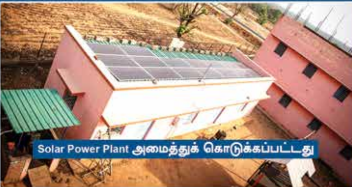
Solar Power Plant அமைத்துக் கொடுக்கப்பட்டது

அந்த பகுதிகளில் மின்சாரம் இல்லாத காரணத்தினால், ‘GEMS’ மிஷனரி ஸ்தாபனத்தின் மூலமாக அங்கு செயல்பட்டு வருகிற ஒரு பள்ளிக் கூடத்திற்கு, சுமார் ₹ 40,00,000 மதிப்பில் Solar Power Plant அமைத்துக் கொடுக்கப்பட்டுள்ளது.