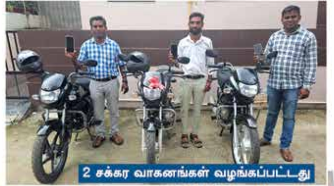
2 சக்கர வாகனங்கள் வழங்கப்பட்டது

என்கிற ஒரு கிராமத்தில், 'ஷாலோம்'-மிஷனரி ஊழிய ஸ்தாபனத்தின் சார்பாக ஒரு பள்ளிக் கூடம் இயங்கி வருகிறது. அங்கு பிள்ளைகள் தங்கிப் படிப்பதற்காக ₹ 45,00,000 செலவில் ஒரு விடுதி (Hostel) கட்டிக் கொடுக்கப்பட்டுள்ளது.