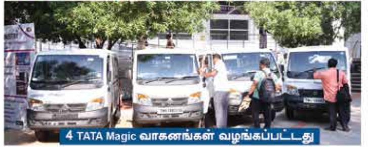
4 TATA Magic வாகனங்கள் வழங்கப்பட்டது

இந்த ஊழியத்தின் மூலமாக தமிழ்நாட்டிலுள்ள சுமார் 6,120க்கும் அதிகமான