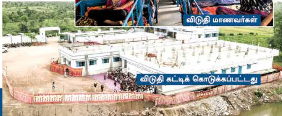
விடுதி கட்டிக் கொடுக்கப்பட்டது