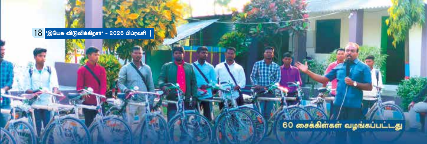
60 சைக்கிள்கள் வழங்கப்பட்டது

கிழக்கு பிஹார் பகுதியில் Harvest Apostolic Ministries சார்பாக மிஷனரி ஊழியங்கள் நடைபெற்று வருகிறது. அந்த மிஷனரிகள் கிராமங்கள்தோறும் சென்று ஊழியம் செய்வதற்கு உதவியாக 60 சைக்கிள்கள் வாங்கிக் கொடுக்கப்பட்டுள்ளது.