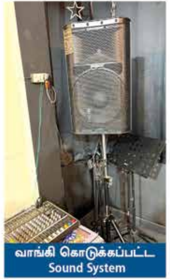
வாங்கி கொடுக்கப்பட்ட Sound System

மட்டுமல்ல, அங்குள்ள ஏழை-எளிய மக்களுக்கு தையல் மிஷின் மற்றும் சிறு தொழில் செய்வதற்கான உபகரணங்கள் வாங்கிக் கொடுத்து, அவர்களுடைய வாழ்வாதாரத்திற்கு தேவையான சில அடிப்படை வசதிகளை செய்து கொடுக்கிறோம்.